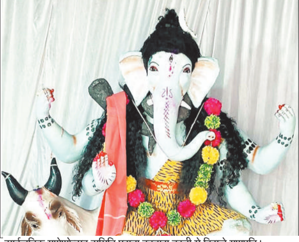
सार्वजनिक गणेशोत्सव समिति पुराना हटवारा बस्ती में विराजे गणपति।