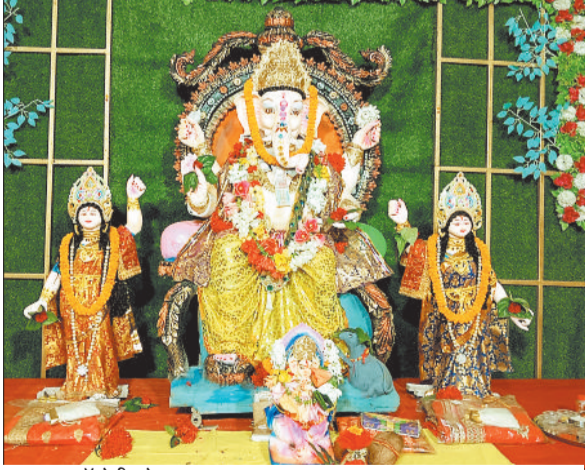
लालूराम कॉलोनी कोरबा।