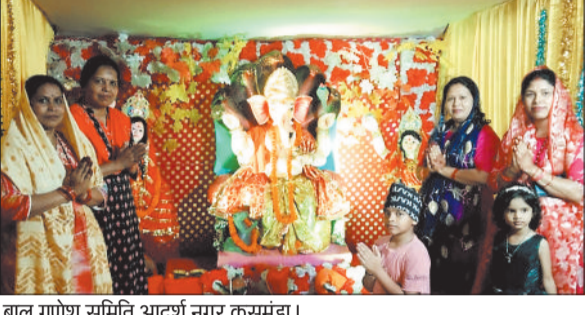
बाल गणेश समिति आदर्श नगर कुसमुंड।