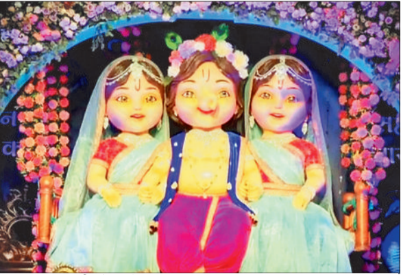
चित्रा टॉकिंग गली कोरबा में विराजित बप्पा।