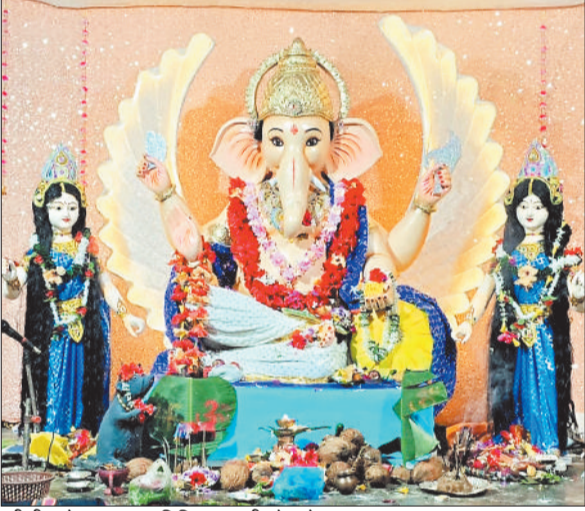
श्रीश्री गणेश उत्सव समिति सरस्वती चौक प्रेमनगर रजगामार।