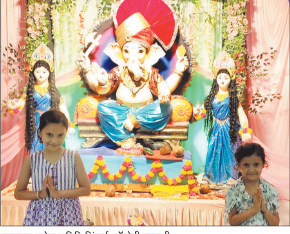
नवयुवक गणेश समिति सिंचाई कॉलोनी बरपाली।