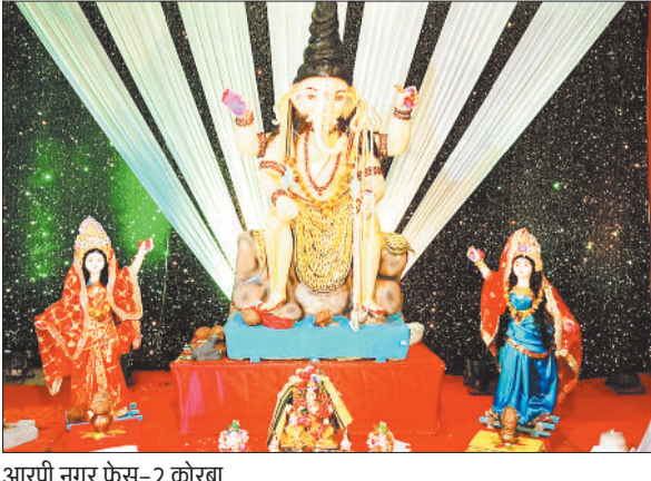
आरपी नगर फेस-2 कोरबा

विश्वविद्यालय प्रबंधन ने बढ़ाई प्रवेश की तिथि, 5 सितंबर तक ले सकेंगे प्रवेश