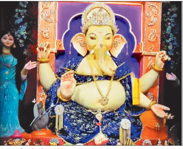
गांजा गली में विराजित गणेश।