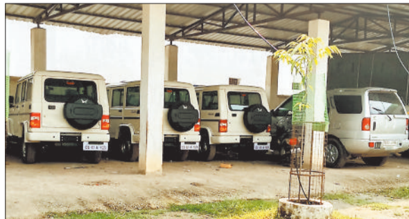
को उपलब्ध कराया गया है। नई बोलेरो गाड़ियों को पुलिस लाइन में रखा गया है। बताया जाता है एक दो दिन में सभी गाड़ियों को उपलब्धता के

बिलासपुर। पुलिस विभाग के पीएचव्यू में प्रस्ताव भेजकर 75 गाड़ियों की मांग की गई, किन्तु ऊंट के मुँह के बरबबर मात्र 12 नई बोलेरो मिली है। नव वाहनों को पुलिस लाइन में रखा गया है। एक दो दिन में उपलब्धता के आधार पर अधिकारी व थानों में गाड़ियों का वितरण कर दिया जाएगा। पिछले साल बिलासपुर रेंज के सभी जिलों में कंडम हो चुके वाहनों विधिवत सभी नीलामी गई थीं। उनके बाद बिलासपुर से 75 नए गाड़ियों की मांग करते हुए पीएचव्यू में प्रस्ताव भेजा गया था। पिछले दिनों पीएचव्यू से मात्र 12 नई बोलेरो गाड़ी जिला पुलिस