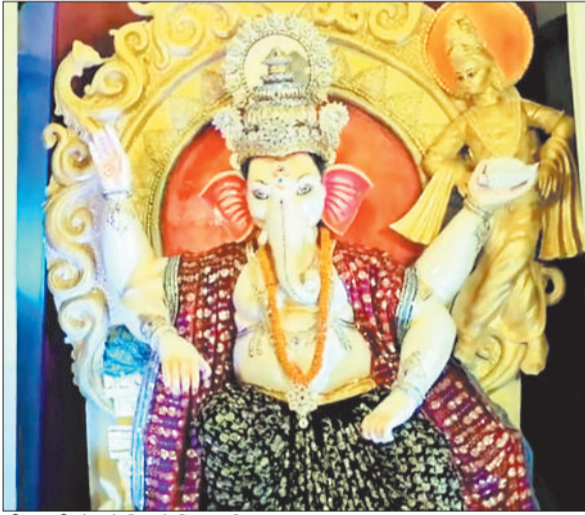
सीतामणी रोड में विराजे विघ्नहर्ता।