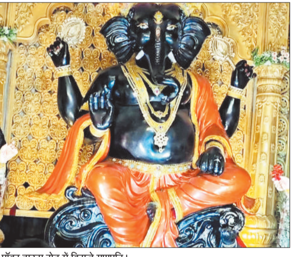
पॉवर हाउस रोड में विराजे गणपति।