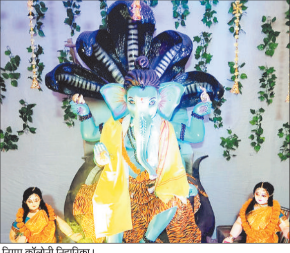
निगम कॉलोनी निहारिका।