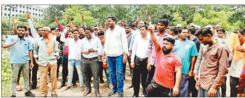
सिरिगिट्टी जौन कार्यालय का घेराव करते नगपुरा के उपभोक्ता।