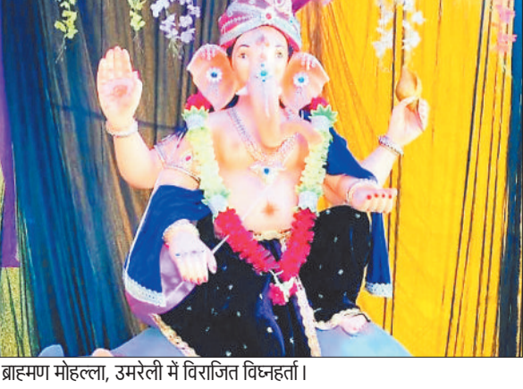
ब्राह्मण मोहल्ला, उमरेली में विराजित विघ्नहर्ता।