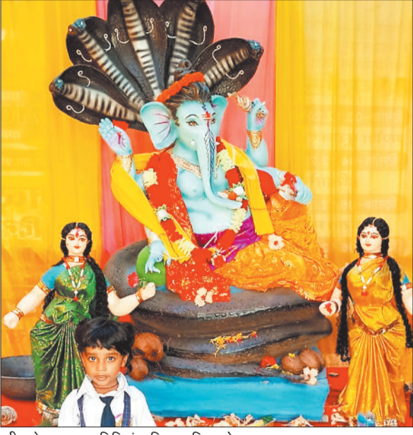
श्री गणेश उत्सव समिति इंडस्ट्रियल एरिया कोरबा।